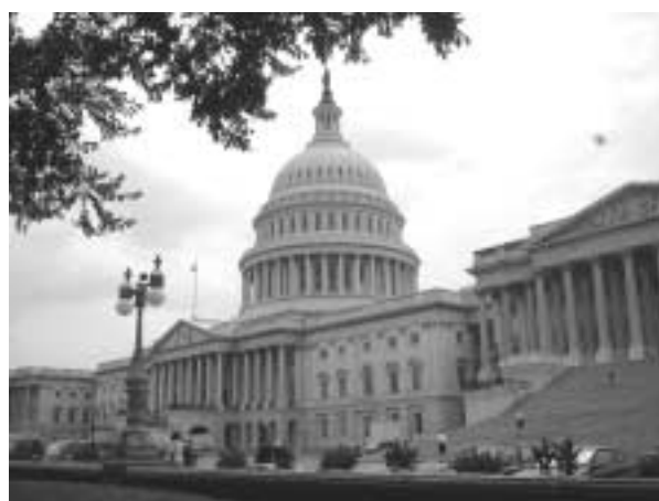
写真1:ワシントン政治の中心連邦議会

そして、リック・バウチャー下院議員(民主党:バージニア州)とクリス・キャンン下院議員(共和