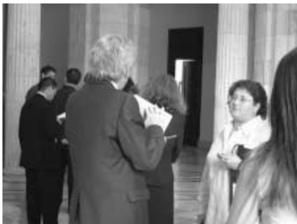
写真2:議会の公聴会に列をなすロビイストたち

住者の感覚としては田舎町だ。ニューヨークから来た人々は、高いビルがなく議会より高い建物を建ててはいけないことになっている。ただし、ワシントン記念塔は例外、人々がゆったり歩いているのに気づく。