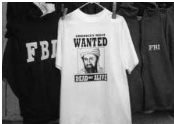
FBIの脇で売られるビンラディンのTシャツ