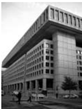
テロ対策に躍起になっているFBI本部