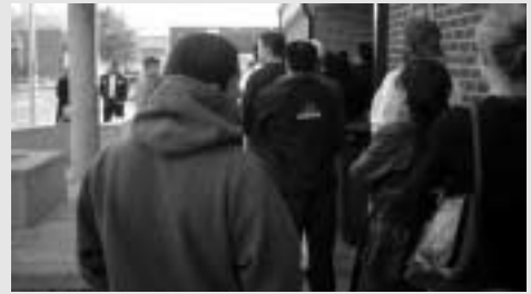
朝8時半にDMVに並ぶ人々

「やった!」という爽快感が体に満ちてくる。アメリカは交渉の国だとよく言うが、説得の国と言ったほうがいい気がする。嫌味をこめて言えば「マネジャーを説得する国」だ。少しアメリカ生活になじんだ気がする。