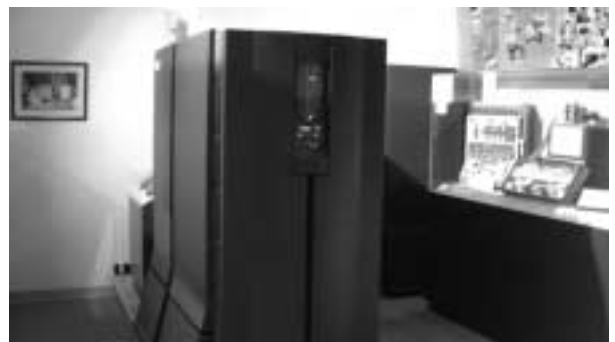
スーパー・コンピュータZIEGLERの巨体

ます時間がかかるようになっている。思い切って簡略化していえば、現代のソフトウェア暗号の解読とは、膨大な桁の数字の素因数分解とっていいそうだ。素数とは、2、3、5、7、11など1より大きい整数のうち、1とそれ自身以外に約数を持たないものである。素数は無限に多く存在する。そして、その分布は不規則になっている。素数と素数の掛け算というのは比較的簡単だ。たとえば、131という素数と47という素数を掛け合わせれば、6157という数字が簡単に出てくる。しかし、6157という数字だけを与えられて、これを素因数分解せよ、と言われたら、2、3、5、7、11...というように順次試して行って、47で割り切れるまで、続けていかななくてはならない。与えられる素数が膨大な桁数になってしまえば、これを素因数分解するには膨大な時間がかかる。その結果、「この暗号を解読するには、現在のコンピュータの性能で数十年かかる」といった言い方で、暗号の強度が説明されることになる。実際にはもっと複雑なアルゴリズム(計算の手続き形式)に基づいて、計算が行われることになる。