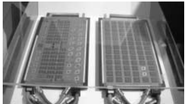
2000年まで使われていたZIEGLERの集積回路