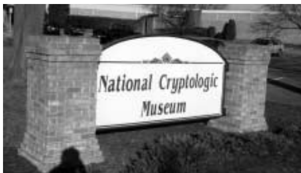
国立暗号学博物館