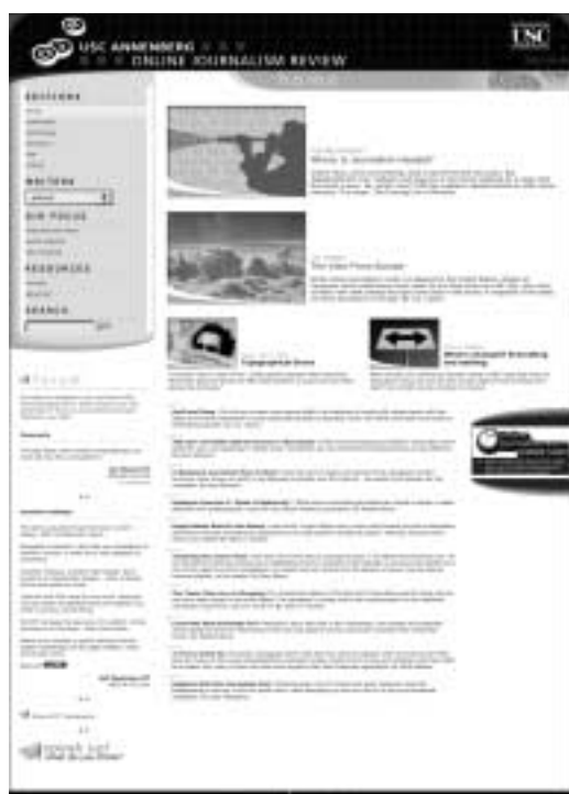
“ Online Journalism Review ” ( http://www.ojr.org )

け相互補完的な関係になっているかが、さまざまな角度から分析された。とくに最近の詳しい調査結果が披露されたが、それによっても、やはり新旧のジャーナリストの間に大きな意識の違いが残っており、旧来型のジャーナリストは、オンラインのニュースは信頼できないという意見が強いようであった。興味深いことに、一般の読者は、かなりオンラインでニュースを入手しており、旧来のジャーナリストの意識のズレが目立っている。