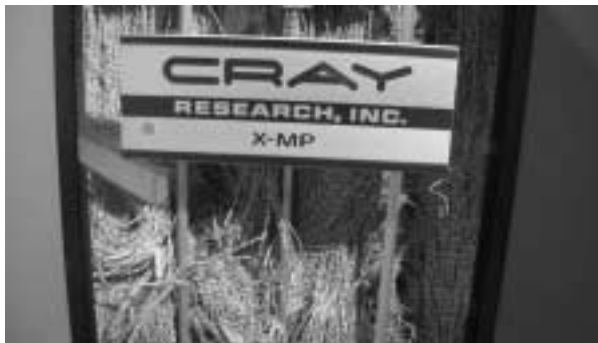
コードが張り巡らされたクレイ社の初期のスーパー・コンピュータ