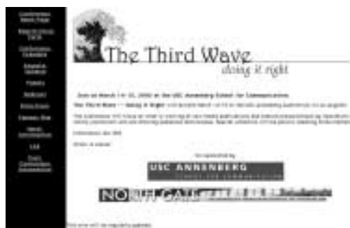
第三の波を乗り切るために ( http://www.annenberg.usc.edu/online2002 )