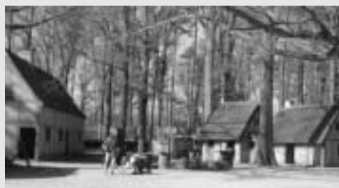
開拓者たちが住んでいた家

貧しかったアメリカが、400年後に世界の覇権国になるとは誰が想像していたらう。イギリスへの忠誠心にあふれた開拓者たちの土地が、やがて独立を勝ちとり、世界を牛耳ることになった歴史は興味深い。