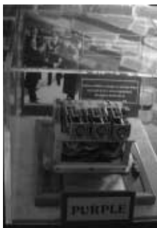
第二次世界大戦中に日本軍が使っていたパープル暗号機