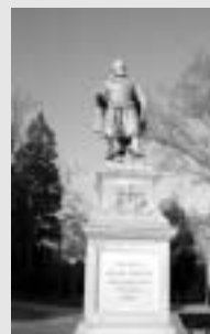
ジェームズタウンの跡地に立つジョン・スミスの像