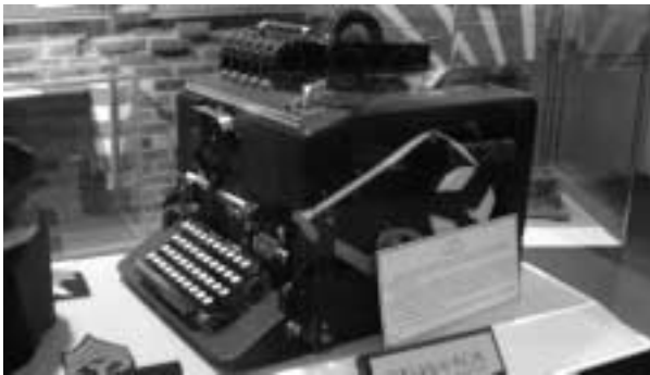
第二次世界大戦中にアメリカ軍が使っていたシガバ暗号機