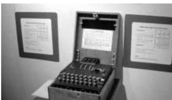
第二次世界大戦中にドイツ軍が使っていたエニグマ暗号機

できた。1943年に山本五十六海軍大将がブーゲンビル島上空で撃墜された事件も、日本海軍の暗号がすでに解読されていたために可能となったのは有名な話だ。