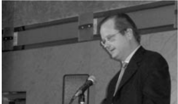
ローレンス・レッシグ教授

きないか。ここで参考になったのは、林紘一郎慶應義塾大学教授の©マークの提唱である。自由に使用できるコンテンツにマークを付けて流通させる考え方で、われわれはそれをクリエイティブ・コモンズ*1と呼んでいる。