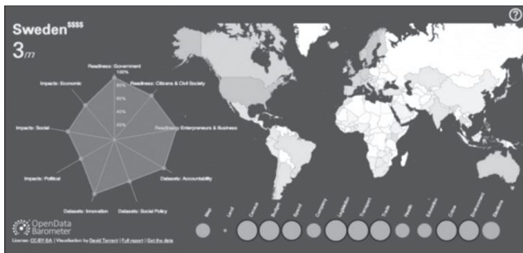
図6 国際公共財の創出へ：ワールド・ワイド・ウェブ財団のオープンデータ・バロメータ

出所：< http://www.opendataresearch.org/project/2013/odb >