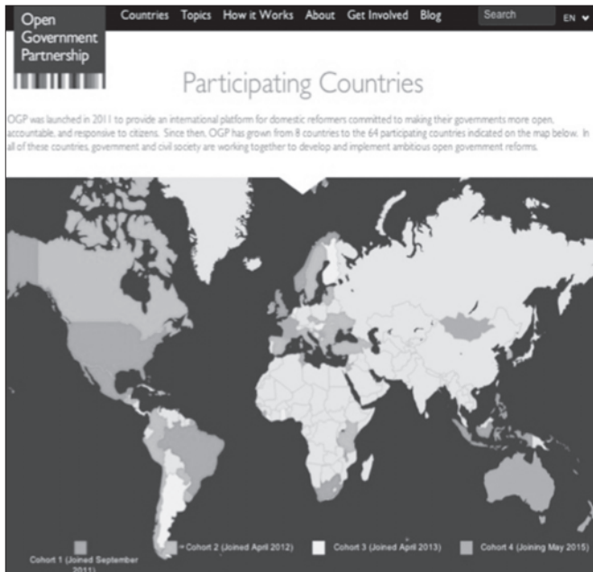
OGPに参加している64カ国